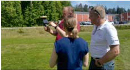
現場説明に効果的

複合現実を使用して効果的なクライアントへの説明が可能です。クライアントは、提示された設計デザイン空間を実際に歩き回り、現場の状況に応じて異なる角度と位置から詳細ディテールを確認し協議することが可能です。