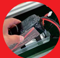
小型軽量バッテリー